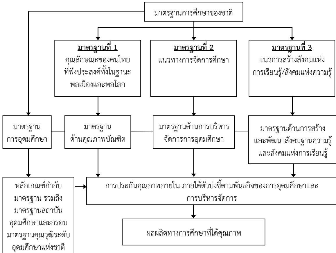
แผนภาพที่ 1.1 ความเชื่อมโยงระหว่างมาตรฐานการศึกษาและการประกันคุณภาพ